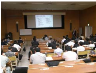
第1回講演会の様子

一方、首都圏では首都高速が閉鎖のため大渋滞が発生し車での移動は不可能でした。また徒歩での帰宅者も途中のトイレなどの問題もあり、結果として、会社に残ったのが正解だったそうです。また冗長性が安全保障のために必要であり、規格の高い道路は4車線必要であること(2車線閉鎖して住民が盛土上に避難した事例がある)や、緊急輸送路の確保や道路のネットワーク化を進めること。人の命を守る耐災(=防災+減災)という考えが必要であることなどについて具体的事例を交えてわかりやすくご説明いただきました。